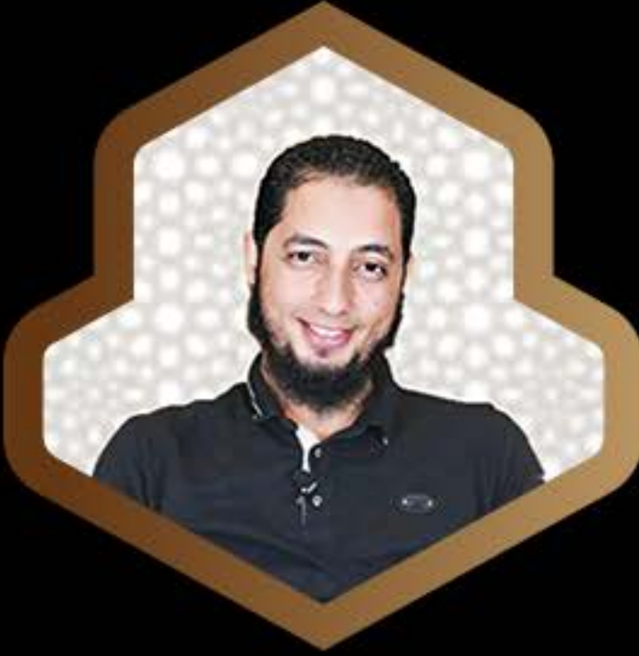
الشيخ محمود عمر